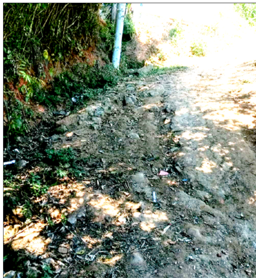
RUA SEM asfaltamento dificulta a locomoção dos moradores da Comunidade

deficiente visual escorregar e cair na terra que fica no caminho e agora sem iluminação está ficando ainda pior. A noite é ruim até para quem consegue andar e enxergar onde pisa, imagina para quem não pode fazer os dois", ressaltou um morador.