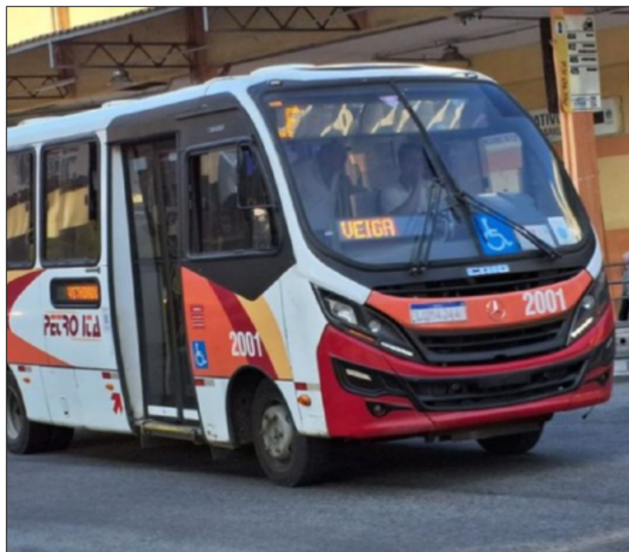
PASSAGEIROS reclamam das condições do coletivo que faz a linha do Gulf

Não obtivemos resposta sobre a situação da CPTrans e Setranspetro até o fechamento desta edição.