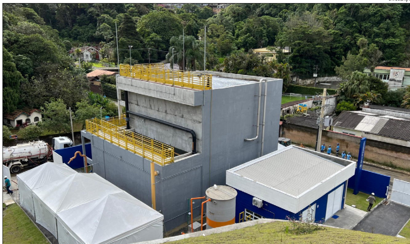
A UNIDADE foi projetada para acompanhar o crescimento da região ao longo dos anos e atender até 22 mil habitantes

“Hoje inauguramos a ETE Independência e celebramos os progressos que tivemos este ano no saneamento básico de Petrópolis. Em junho inauguramos a ETE Itaipava e, além do tratamento de esgoto, ampliamos também no abastecimento de água para regiões que ainda não eram atendidas. Para ano que vem já temos o projeto da ETE Itamarati, para que possamos seguir avançando”, destacou o diretor da Águas do Imperador,