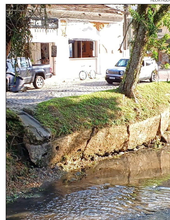
MOTORISTAS temem a queda de parte da rua

Apesar da gravidade da situação, questionada sobre os reparos necessários, a Prefeitura de Petrópolis não respondeu até o fechamento desta edição.