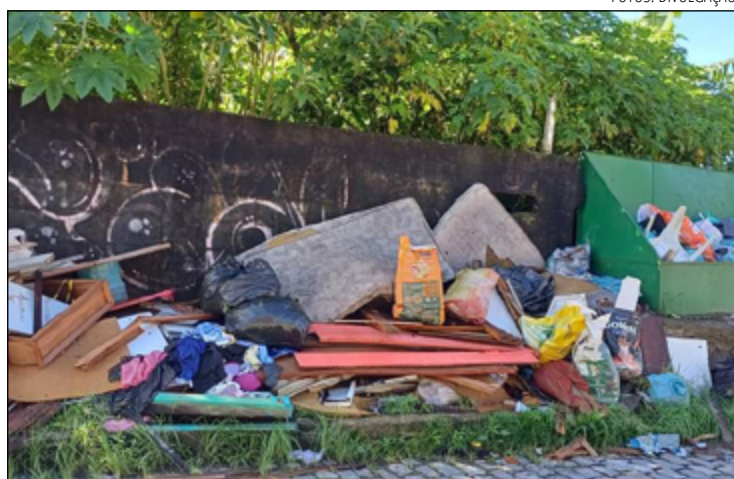
MORADORES pedem a coleta de lixo e entulhos da calçada