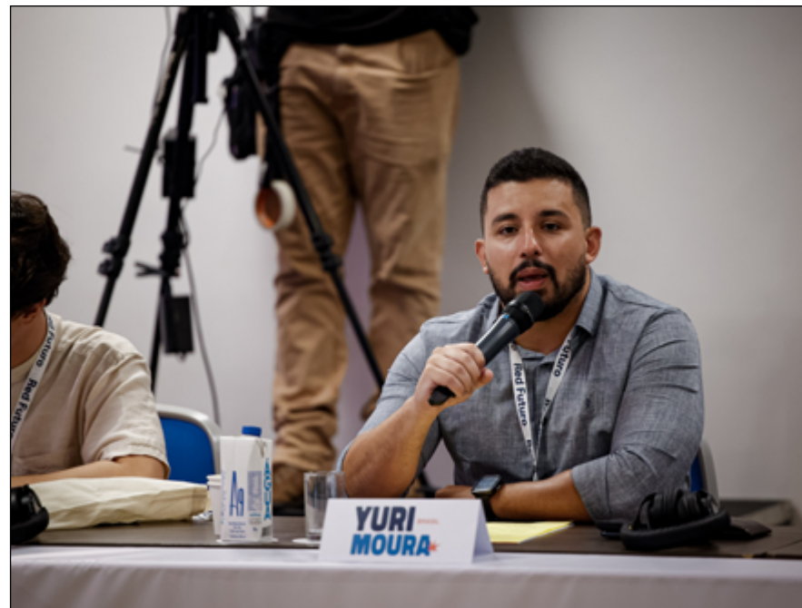
O DEPUTADO Yuri Moura foi um dos convidados para o Cidades do Futuro

Em seu discurso, Yuri enfatizou a relevância do municipalismo, destacando que “a vida acontece na cidade”, onde políticas públicas, investimentos e oportunidades devem ser priorizados. “Num momento de crise urbana e climática, é fundamen-