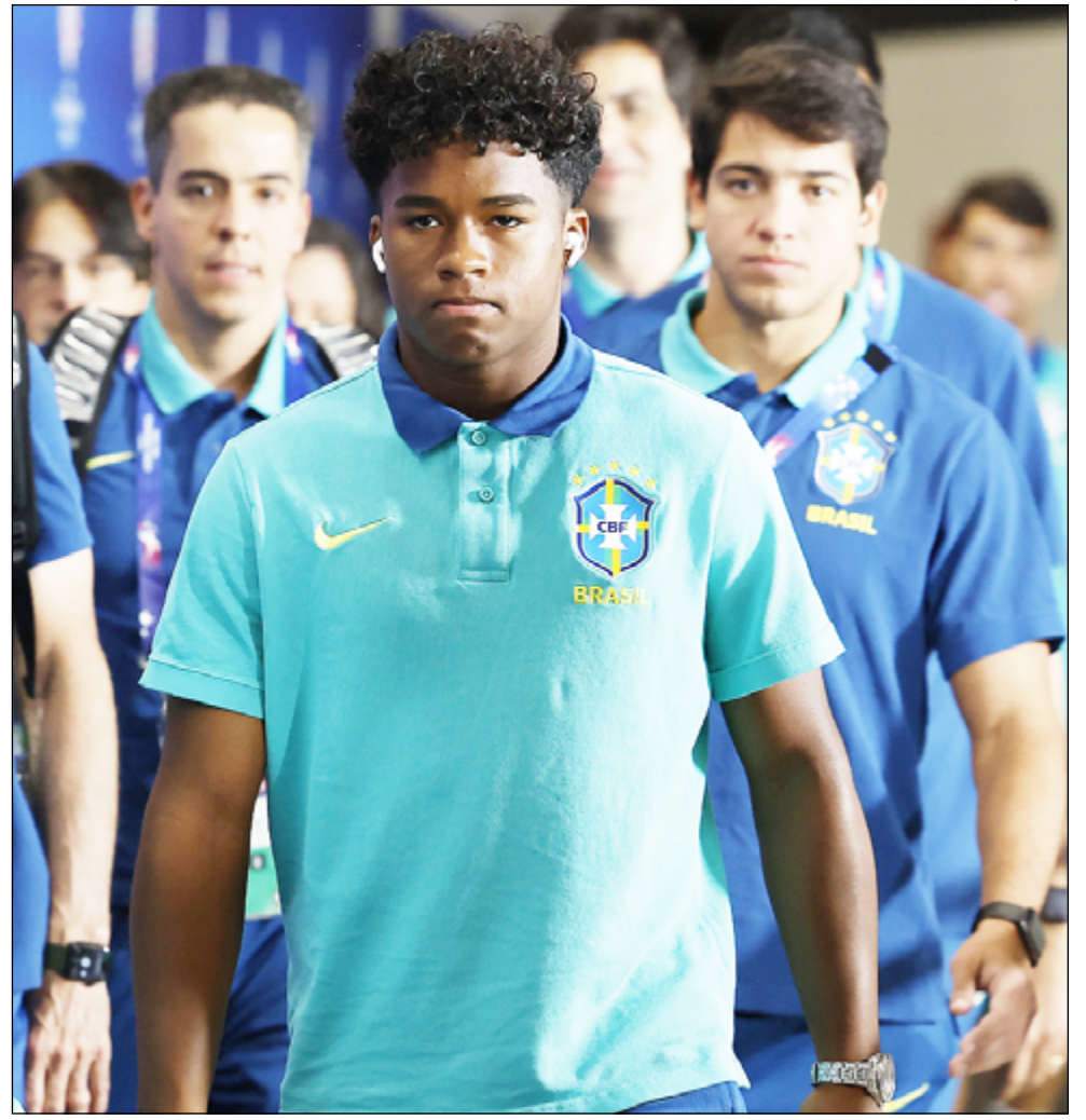
ENDRICK, de 17 anos, será o substituto de Vinicius Junior, que cumpre suspensão

A partida entre Brasil e Uruguai terá transmissão ao vivo pela Tv Globo a partir das 22h de hoje.