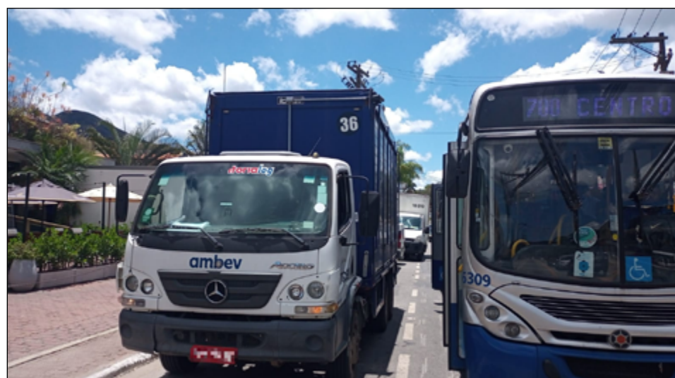
CAMINHÕES estacionados diariamente no ponto de ônibus prejudicam embarque

O estacionamento irregular é um problema crônico em diversos bairros da cidade. Com isso, o trânsito fica prejudicado, mas, quem mais sofre são os passageiros do transporte coletivo. Exemplo disso são caminhões estacionados no ponto de ônibus, localizado próximo ao Multimix, na Estrada União e Indústria, em Itaipava. "A irregularidade segue prejudicando diariamente o embarque e desembarque dos passageiros de três linhas de ônibus, além de gerar retenções no trânsito. As linhas afetadas são a 605 - Vale das Videiras, 617 - Araras e 700 - Terminal Itaipava", informou a Turp Transporte.