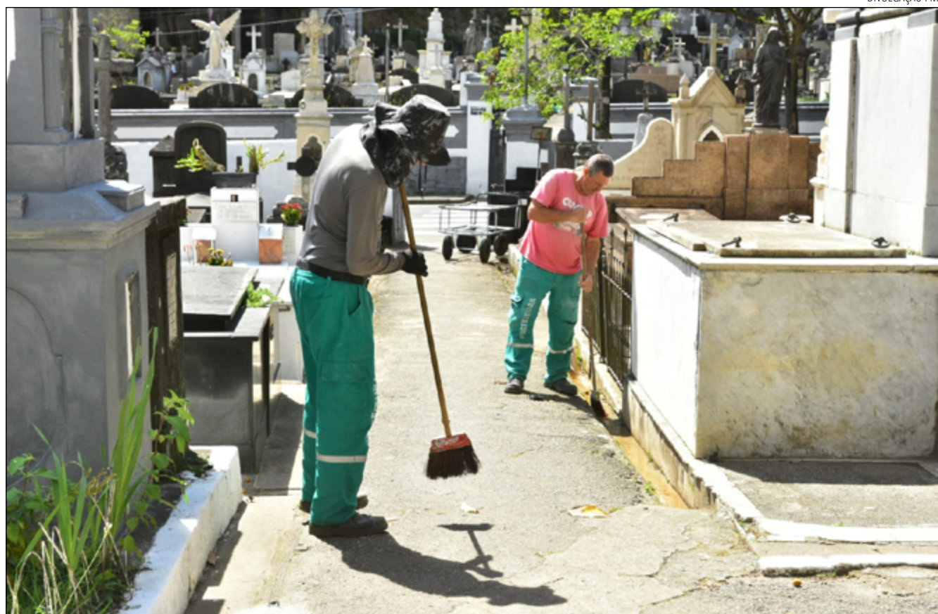
CEMITÉRIOS do município passaram por manutenção para receberem os visitantes que vão homenagear entes queridos

As repartições públicas do município estarão fechadas, bem como as unidades escolares e