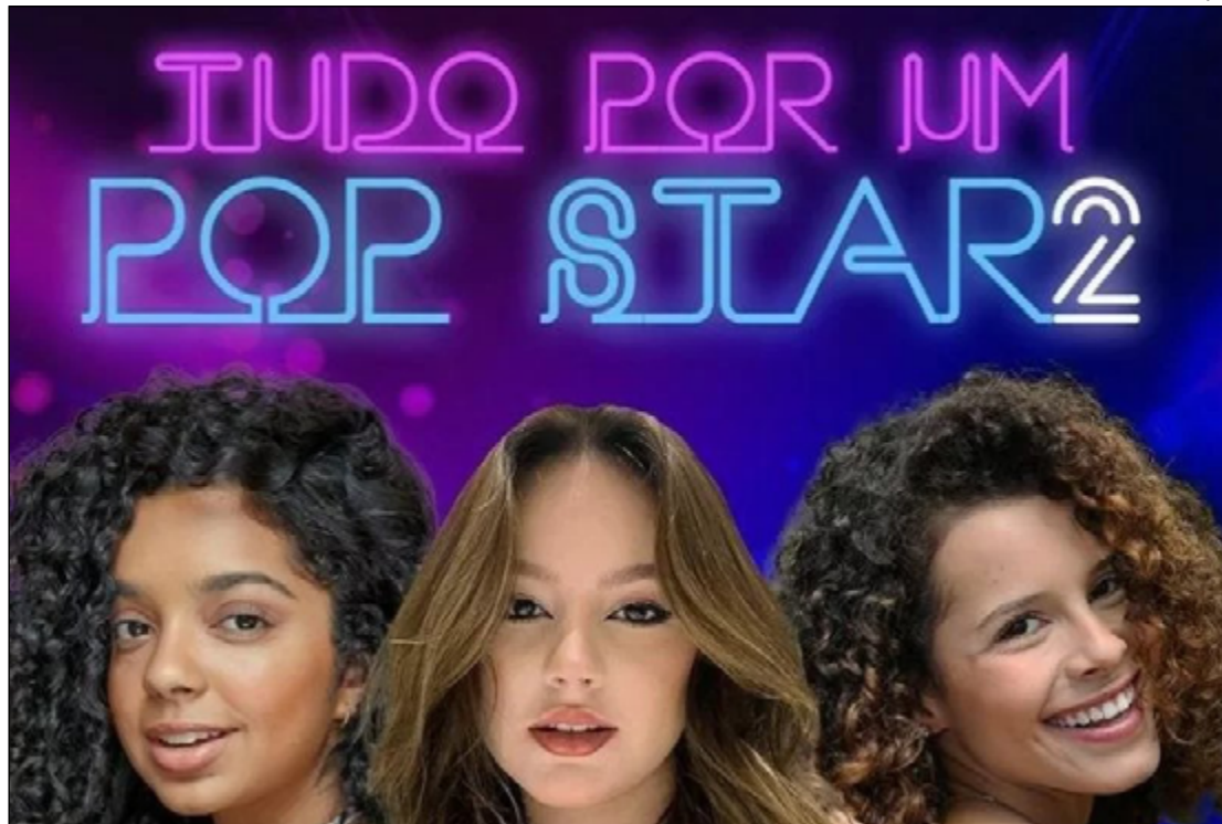
Três amigas se aventuram em uma viagem para encontrar com seu ídolo

Em My Hero Academia - Agora é a Sua Vez, se passa após a épica batalha entre All Might (Kenta Miyake), o símbolo da paz, e All For One, o emblemático símbolo do mal, a era dos heróis toma um novo rumo. Embora All Might tenha se afastado do papel de herói número 1, seus ideais e