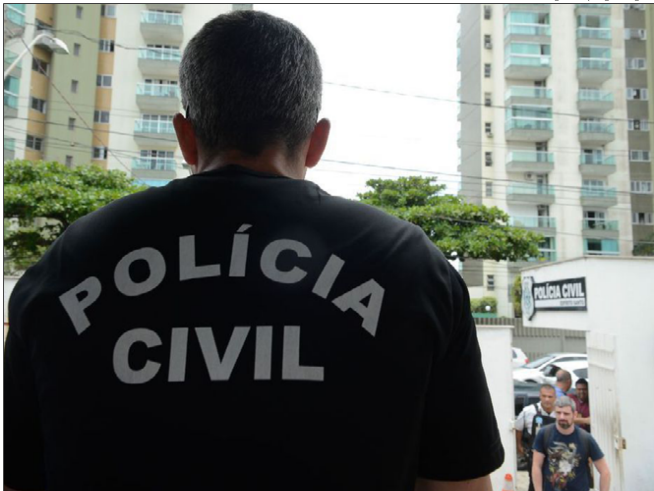
POLÍCIA cumpriu quatro mandados de prisão preventiva e 10 de busca e apreensão contra integrantes do grupo

São alvos dos mandados de prisão o ex-policia militar Thia-