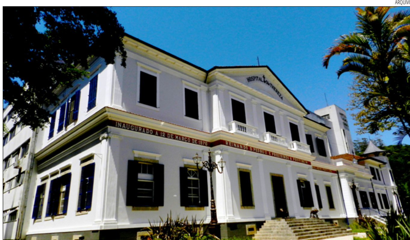
HOSPITAL Santa Teresa, que é referência no atendimento a acidentados na cidade, registrou 168 vítimas em setembro

Referência no atendimento a acidentados, a Sala de Traumas do Hospital Santa Teresa registrou a entrada de 168 vítimas no mês de setembro. Número representa alta de quase 10% em comparação a agosto. As internações relacionadas a acidentes de trânsito representam 72% das entradas na unidade hospitalar. Foram 80 acidentes motociclistas, liderando o topo da lista, novamente. Os dados foram coletados a partir dos atendimentos realizados pelo convênio e pelo Sistema Único de