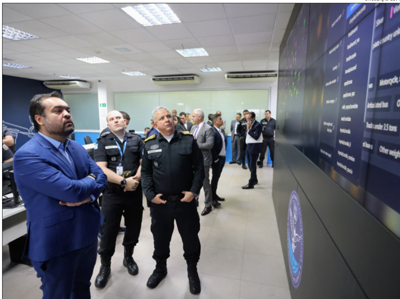
GOVERNADOR Cláudio Castro visita nova sala de Operações e Inteligência do Centro Integrado de Comando e Controle

Também nos oito primeiros meses do ano, as polícias Civil e