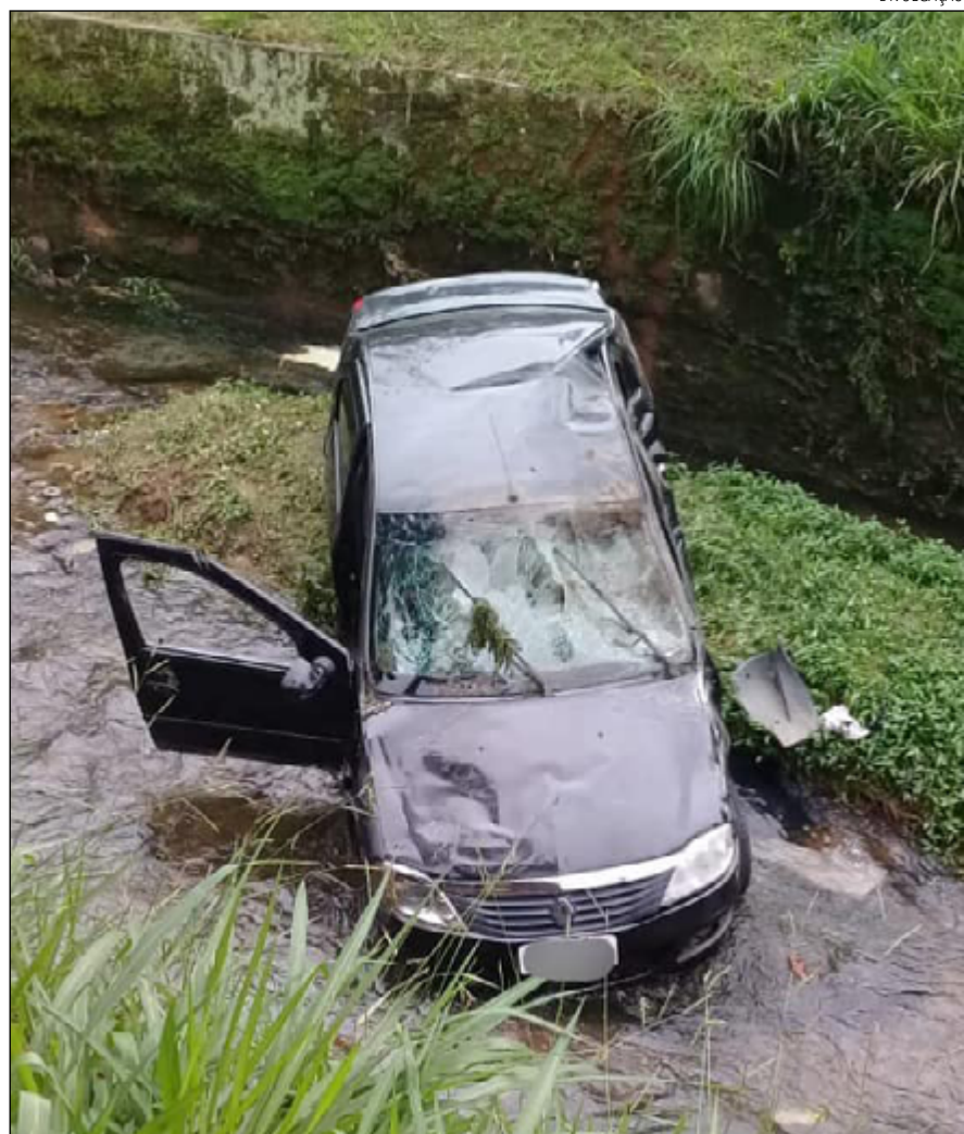
AS INTERNAÇÕES relacionadas ao trânsito representam 72% das entradas

A Sala de Trauma revela também que 34 vítimas se internaram após caírem de uma altura considerável para se machucar; três pessoas foram agredidas e outras nove ocorrências não foram especificadas. A unidade também faz o levantamento mensal dos casos de perfuração por arma branca, queimadura, perfuração de arma de fogo e linha de pipa. Essas categorias ficaram zeradas em setembro.