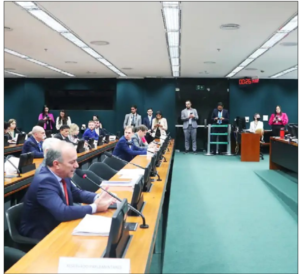
APÓS A aprovação na CCJ da Câmara, a PEC segue para uma comissão especial

A PEC 8/2021 proíbe decisões monocráticas que suspendam a eficácia de lei ou ato normativo com