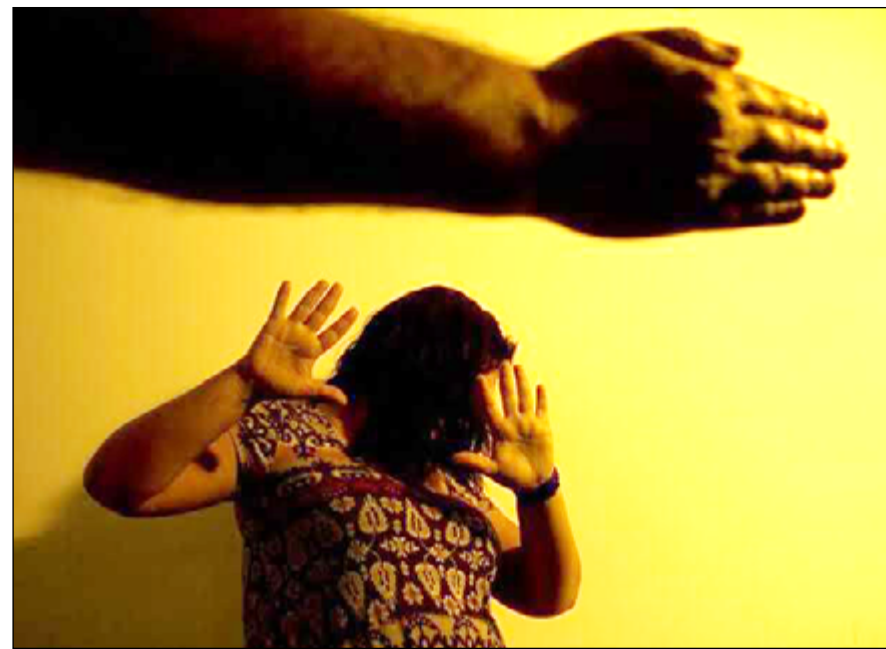
BOA PARTE dessas mulheres que sofreram algum tipo de crime são solteiras

Boa parte dessas mulheres que sofreram algum tipo de crime, são solteiras e com o ensino fundamental incompleto. Como pessoas com fundamental incompleto estão mais ligadas às classes C e D, isto mostra que as mulheres de baixa renda estão mais suscetíveis a sofrer algum tipo de violência. Segundo o ISP, 48,2% são solteiras e 32,4% são casadas ou com união estável. Além do mais, 33,3% não têm o