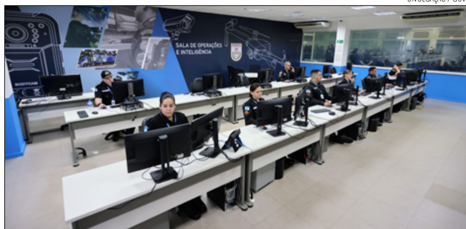
CASTRO destaca o estado do Rio como referência em tecnologia e inovação na segurança