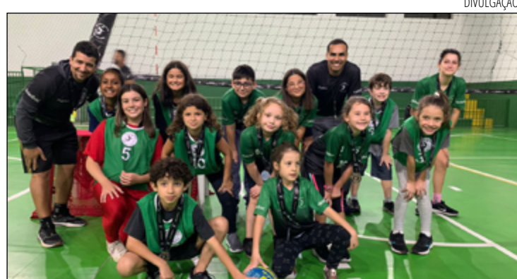
O FESTIVAL de Vôlei vai reunir as crianças de todos os polos

A expectativa é de participação de pelo menos 200 crianças, mais os familiares e convidados, que também vão poder entrar nas brincadeiras. A entrada para o Festival de Vôlei é gratuita.