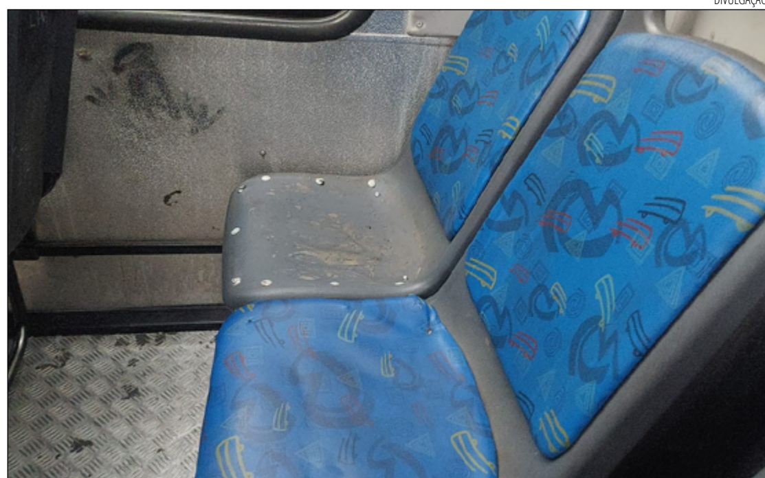
DEPREDAÇÃO de ônibus é crime previsto no artigo 163, do Código Penal e foi registrada ocorrência

Já na tarde de terça-feira (3), imagens que circulam nas redes sociais mostram um adolescente arrancando e arremessando o estofado do ônibus 6077 pela janela. O coletivo operava a linha 609