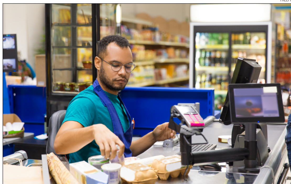
ENTRE AS oportunidades oferecidas para esta semana está a de operador de caixa com cinco vagas

Auxiliar Administrativo - Ensino Médio Disponibilidade para viajar