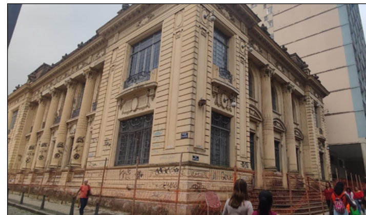
PRÉDIO histórico está pichado e precisando de manutenção

A situação hoje que se vê na fachada continua sendo de muita pichação. Em alguns pontos na lateral, mesmo com a cerca, é possível ver que pessoas depositaram sacolas de