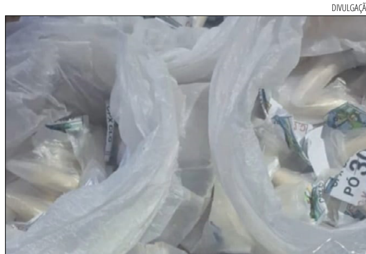
MAIORIA das denúncias foram sobre tráfico de drogas na cidade

No ano de 2025, já foram realizadas 69 denúncias por tráfico de drogas, 51 denúncias contra maus tratos a animais, 32 denúncias relacionadas a barulho, 27 por guarda ou comércio de animais sil-